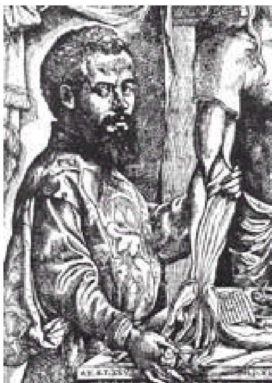
Fig.1.-Primera reproducción precisa del cuerpo humano. Muy reducida, de una lámina en De fabrica corporis humani , por Andrés Vesalio , 1543

Históricamente, podríamos señalar que la BIOLOGIA comienza desde que el hombre toma conciencia de sí mismo y se ve diferente a los demás componentes del medio biótico y abiótico.